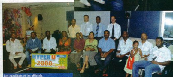
Les candidates et les officiels.